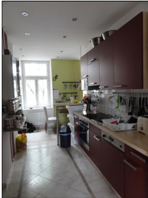
Küche, Blick Innenhof